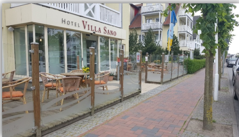
Hotel Villa Sano